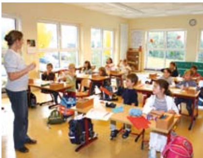
Differenzierte Lernformen durch kleine Klassen

Nach dem Prinzip „Eine Person – eine Sprache“ spricht eine Lehrkraft nur Deutsch, die andere nur Englisch. Alles, was die fremdsprachliche Lehrkraft sagt, verstärkt sie durch Mimik, Gestik oder Zeigen. Das Kind erschließt sich dann die Sprache eigenständig Stück für Stück aus dem Zusammenhang der Situation. Dies bildet die natürliche Art nach, wie Kinder Sprachen lernen, gleichgültig ob als erste oder zweite. Immersion verfährt daher kindgerechter als jede andere Methode. Sie motiviert stark und kommt ohne Zwang und Leistungsdruck aus. Immersion überfordert kein Kind. Deshalb gilt Immersion als die erfolgreichste Methode der Sprachvermittlung. Immersion macht den Kindern im Kindergarten und der Grundschule häufig mehr Freude als deutschsprachiger Unterricht; Immersionsunterricht ist vielseitiger.