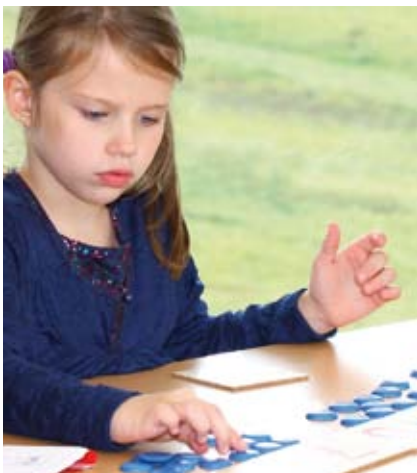
Mathe kann spannend sein

Der Unterricht erfolgt auf der Grundlage der Hessischen Rahmenpläne und Stundentafeln, ergänzt um Zusatzstunden für den englischsprachigen Unterricht. Die Fächer Mathematik, Kunst, Werken, Textiles Gestalten, Sport und Musik werden teilweise in englischer Sprache unterrichtet. Der Anteil des englischsprachigen Unterrichts beträgt zwischen 44 Prozent und 50 Prozent; der Anteil erhöht sich durch die Betreuungsangebote am Nachmittag, die ebenfalls in englischer Sprache durchgeführt werden.