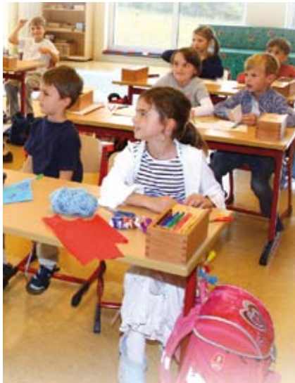
Die Klassenstärke beträgt ca. 22 Schülerinnen und Schüler