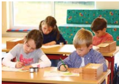
Die rhythmisierte Stundentafel gewährt eine effektive Lernorganisation