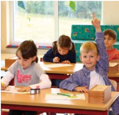
Der bilinguale Unterricht vermittelt Sprachsicherheit für die Zukunft